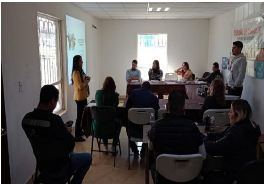
San Luis Río Colorado